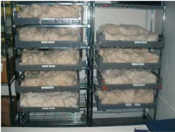
图例: 湿平衡时棉样的存放[Uster]

( 建议 ) 定时检查棉样的含水率是非常重要的。对于陆地棉而言，含水率不应超出 6.75 至 8.25% (干基) 的范围并且与校准棉样的不同要小于 1%。超出范围的棉样需要更长的时间进行平衡，对于仍然达不到要求的棉样必须作“异常”标记。